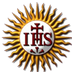
Compagnie de Jésus (Jésuites)