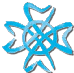
Augustins de l'Assomption (Assomptionnistes)